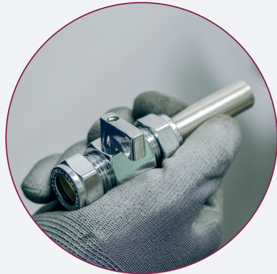
THE VALVE IS IN THE CLOSED POSITION / LA VALVOLA È IN POSIZIONE DI CHIUSURA