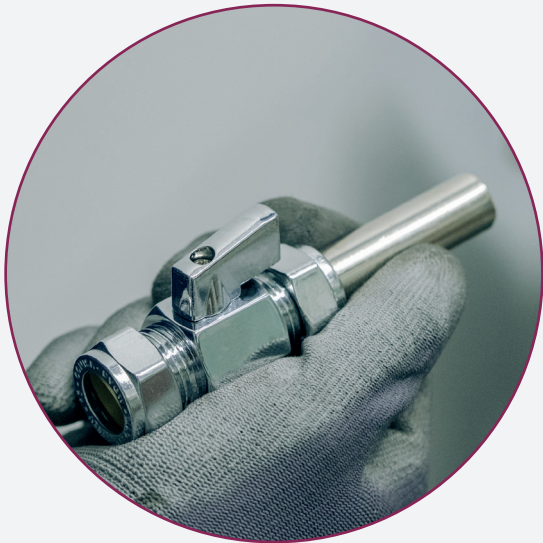
THE VALVE IS IN THE OPEN POSITION / LA VALVOLA È IN POSIZIONE DI APERTURA